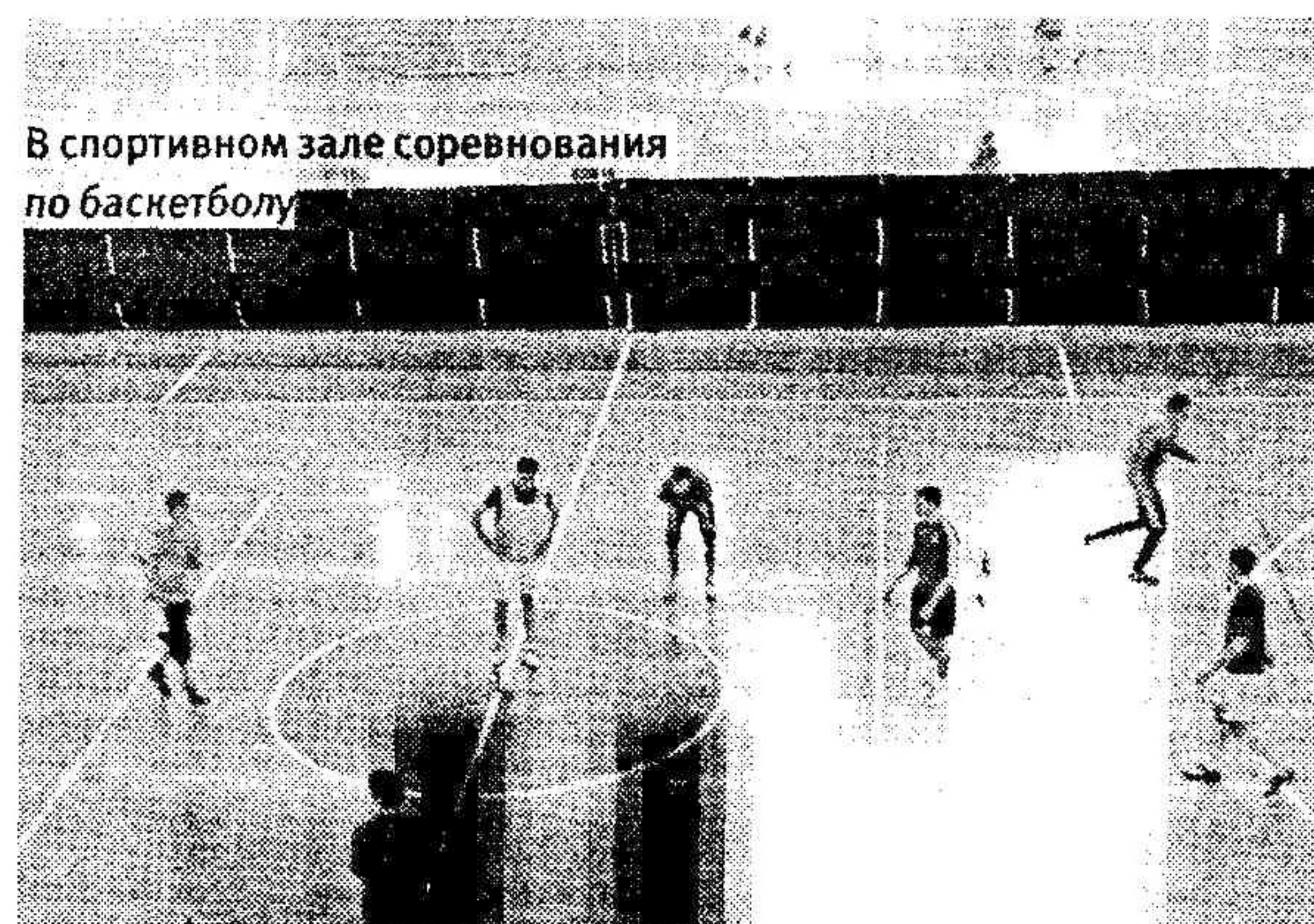
В спортивном зале соревнования по баскетболу

«МосОблСтрой», выступившей подрядчиком и вице-президент компании «Эдельшталь-Швиммбаудн Металльбау».