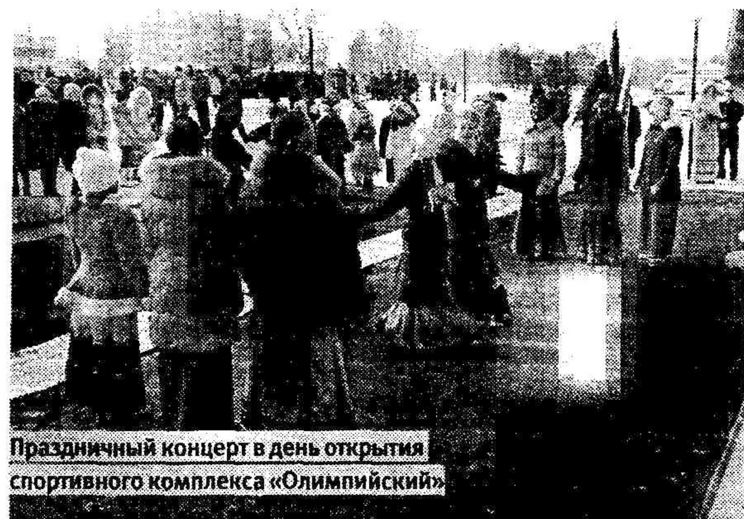
Праздничный концерт в день открытия спортивного комплекса «Олимпийский»